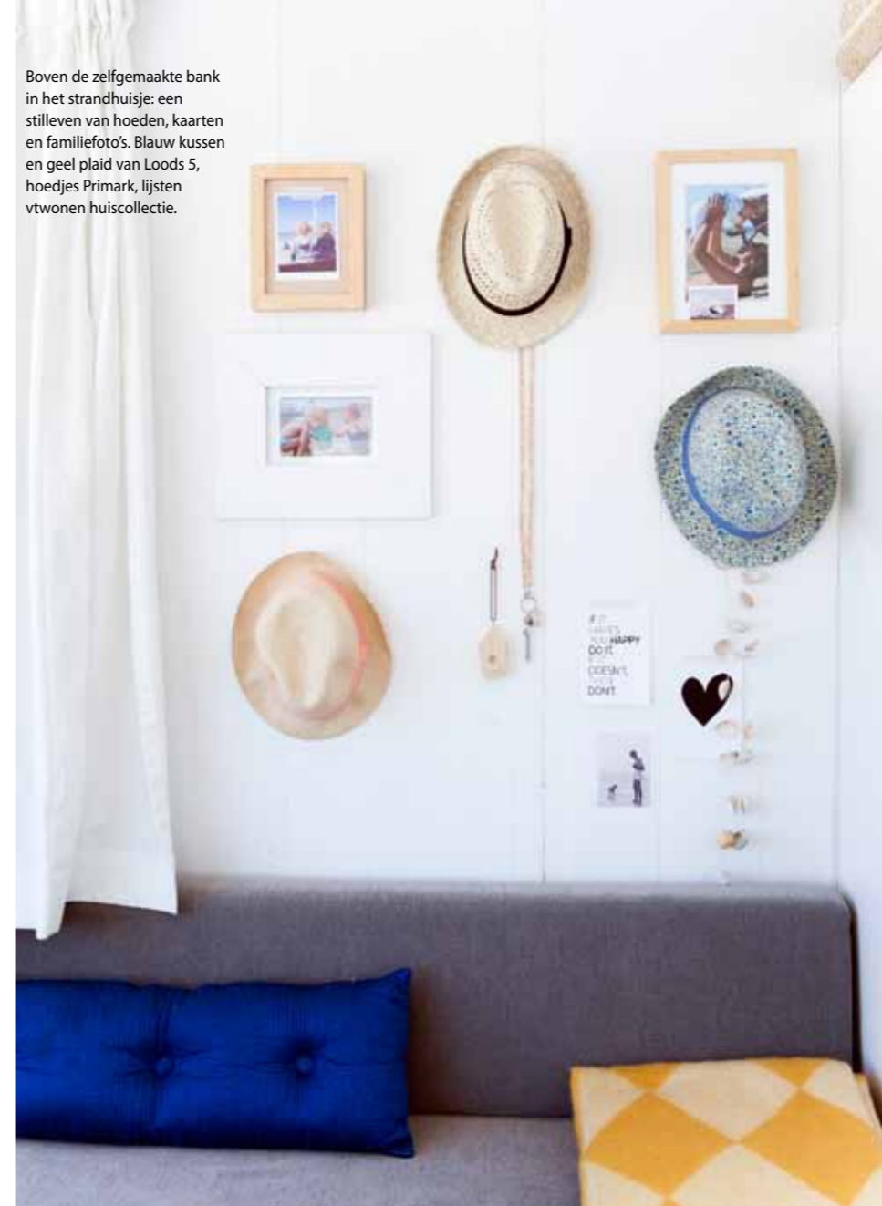
Boven de zelfgemaakte bank in het strandhuisje: een stilleven van hoeden, kaarten en familiefoto's. Blauw kussen en geel plaid van Loods 5, hoedjes Primark, lijsten vtwonen huiscollectie.

huizen blijven, ben ik bang. Ik ben er te wispelturig en chaotisch voor. En dat is oké, want met kleine kinderen is een praktisch en gezellig huis veel fijner. Een huis waarin je kunt leven. Ondertussen spaar ik eindeloos woonideeën voor dat éne grote leefhuis met witte gietvloer en open haard dat ooit zal komen.' Wat zijn je plannen voor de toekomst? 'Mijn liefde voor papieren magazines is nog altijd het grootst, maar dat neemt niet weg dat ik mijn blog verder wil ontwikkelen. Ik heb de ambitie om ooit met een complete redactie een online magazine te maken. Het lijkt me fantastisch om samen met collega's met dezelfde passie iets bijzonders te creëren voor zo'n immens publiek. Want mooie dingen maken, is wat ik het liefst doe.'