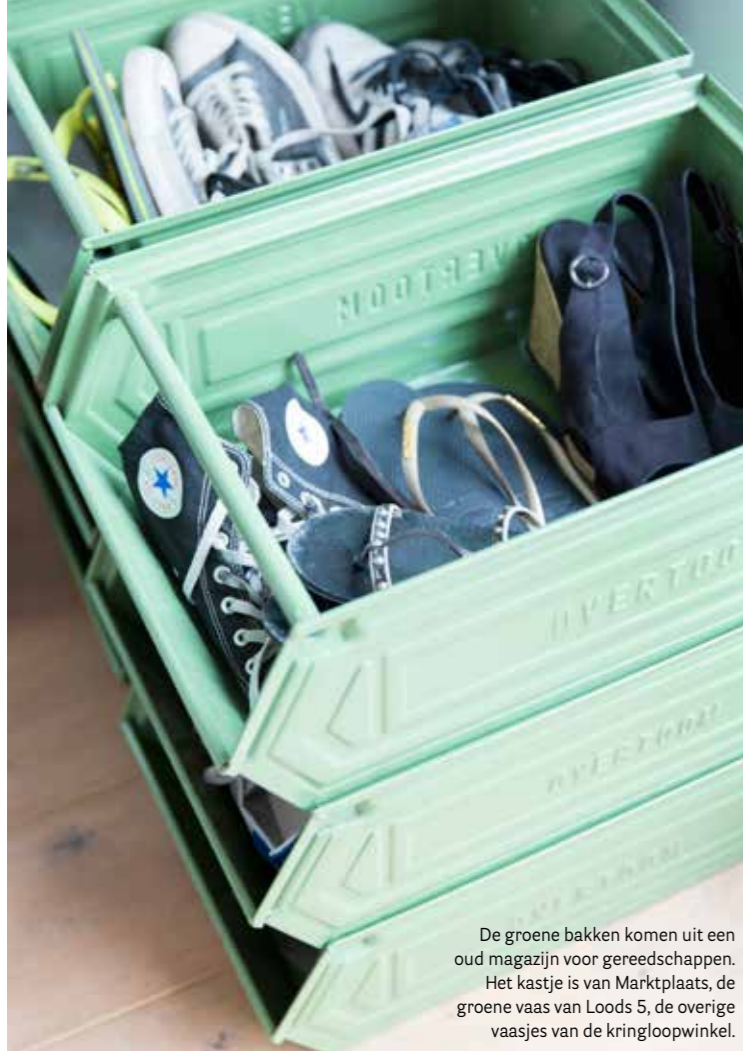
De groene bakken komen uit een oud magazijn voor gereedschappen. Het kastje is van Marktplaats, de groene vaas van Loods 5, de overige vaasjes van de kringloopwinkel.