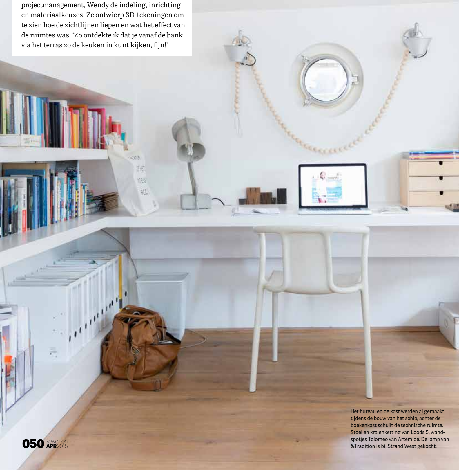
Het bureau en de kast werden al gemaakt tijdens de bouw van het schip, achter de boekenkast schuilt de technische ruimte. Stoel en kralenketting van Loods 5, wand-spotjes Tolomeo van Artemide. De lamp van &Tradition is bij Strand West gekocht.

“ Door de patrijspoorten komt vaak wit, maar soms ook knalgeel licht ”